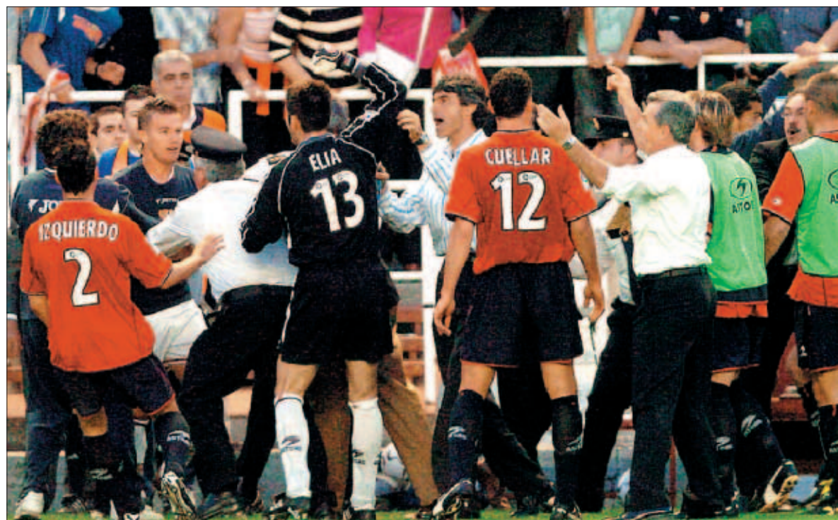
Tangana en los banquillos A la media hora llegó la primera pelea y al final del encuentro Bakayoko y Pablo Alfaro fueron expulsados

El Sevilla se clasificó para disputar la Copa de la UEFA nueve temporadas después tras vencer a Osasuna y aprovecharse del tropiezo del Villarreal en Valladolid. La victoria del cuadro hispalense fue muy trabajada. Llegó gracias a un tanto del brasileño Baptista, quien con este gol