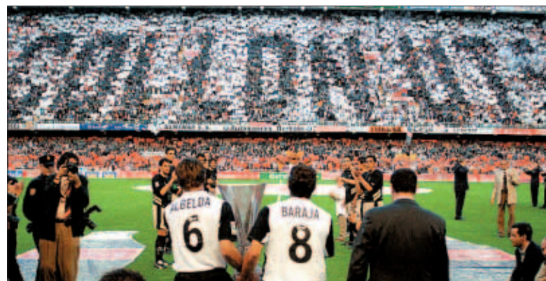
Un gran mosaico recibió la Copa de la UEFA y a los jugadores del Valencia